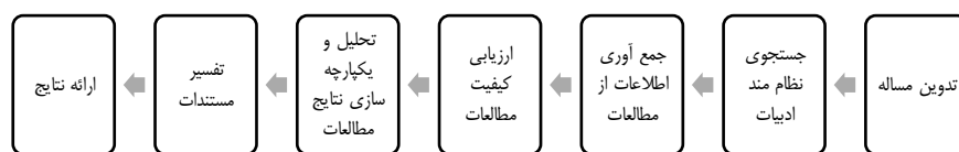
شکل (۱): مراحل مرور نظام‌مند (کوپر، ۲۰۱۵)

مرور نظام‌مند دارای سه بخش اصلی است (گوق ۲۵ و همکاران، ۲۰۱۷): تعیین و توصیف تحقیق‌های مرتبط (ترسیم نقشه تحقیق)، ارزیابی منتقدانه تحقیق‌ها به روشی نظام‌مند و گردآوری یافته‌های تحقیق‌ها (ترکیب). شکل ۱ فرایند انجام مرور نظام‌مند را نمایش میدهد. این فرایند هفت مرحله ای (کوپر، ۲۰۱۵) توسط بسیاری دیگر از پژوهشگران نیز به کار گرفته شده است.