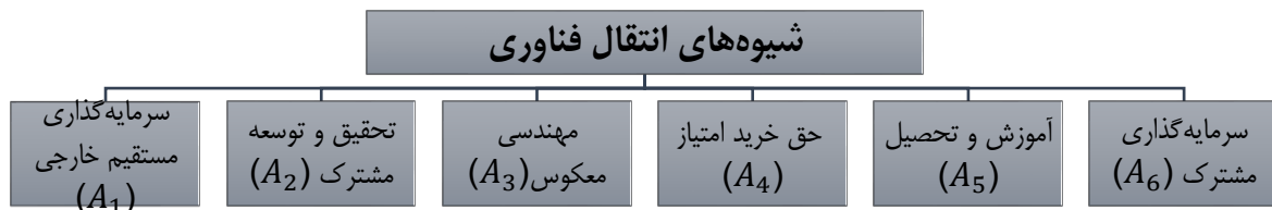
شکل (۲): شیوه‌های انتقال فناوری در صنایع باتری سازی خودرو در سطح جهانی

منظور از روش‌های انتقال فناوری، مجموعه‌ای از فعالیت‌ها در شرایطی تعریف شده است که طی آن، فناوری مورد نیاز متقاضی، در ازای جلب رضایت عرضه‌کننده، در اختیار وی قرار می‌گیرد. روش‌های انتقال فناوری، براساس نوع فناوری و شرایط انتقال، متفاوت و در بعضی از موارد بسیار متنوع است (شکل ۲). مطابق با مرور ادبیات صورت گرفته و همچنین مصاحبه با خبرگان روش‌های بالقوه انتقال فناوری در سطح جهانی به شرح زیر شناسایی شدند.